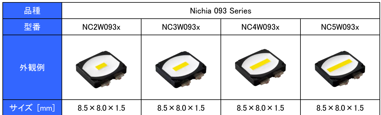
表 1. 適用品種