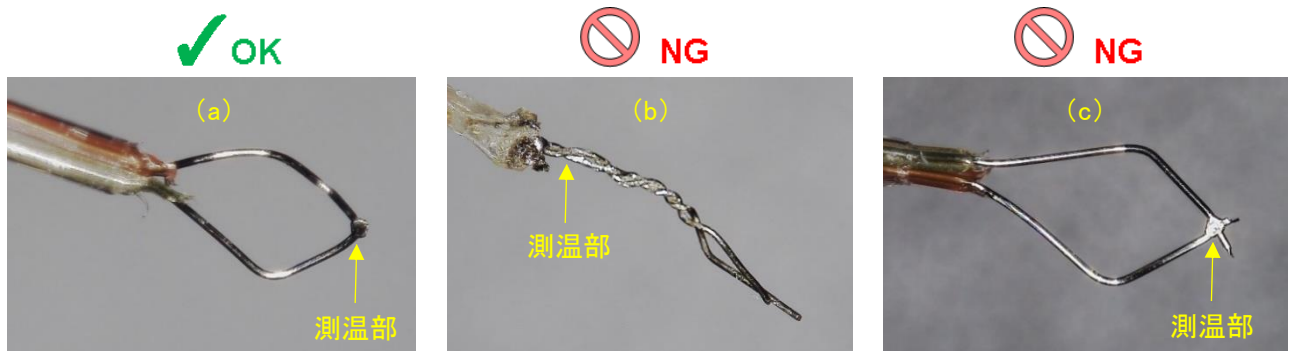
図 3. 熱電対の測温位置

熱電対の測温位置は、接合もしくは接触の根元部分です。図 3(b)のように根元でねじれた熱電対では、先端部分ではなく、ねじれの部分で測温します。熱電対先端が T MP 測定ポイントに接触していても、測温部が離れてしまうと T MP が低くなる可能性があります。測温部が T MP 測定ポイントに接触するようご注意ください。